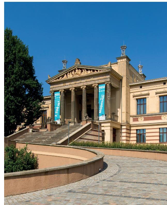
Staatliche Museum Schwerin, Foto: Michael Setzpfandt